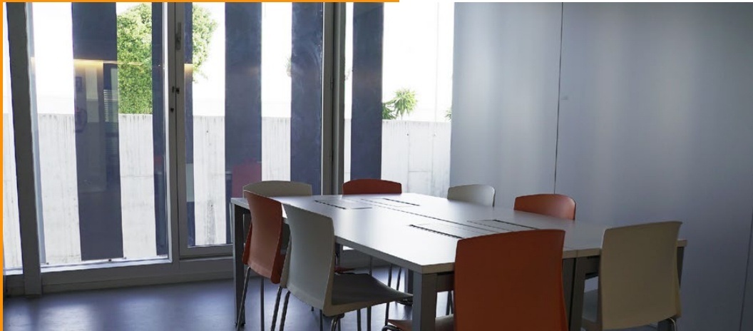
Sala de reuniones en Edificio Pasarela