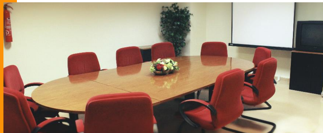
Sala de reuniones en Edificio Polivalente I