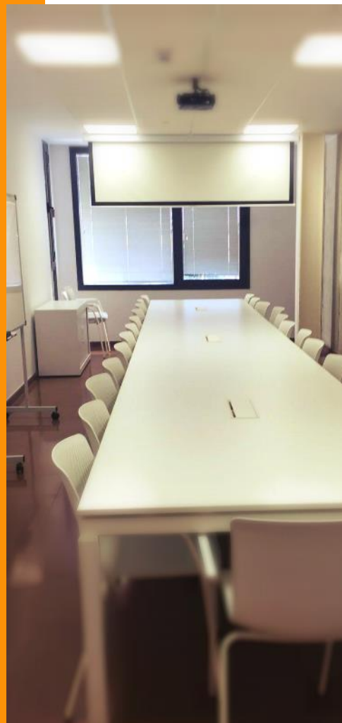
Sala de juntas B en Edificio Polivalente III