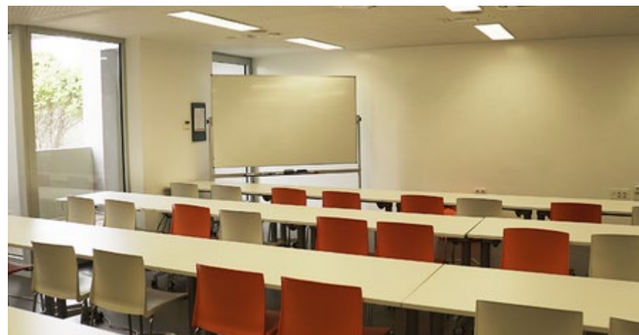
Sala Global 30 en Edificio Incube