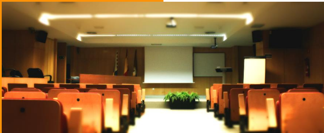
Salón de actos en Edificio Polivalente I