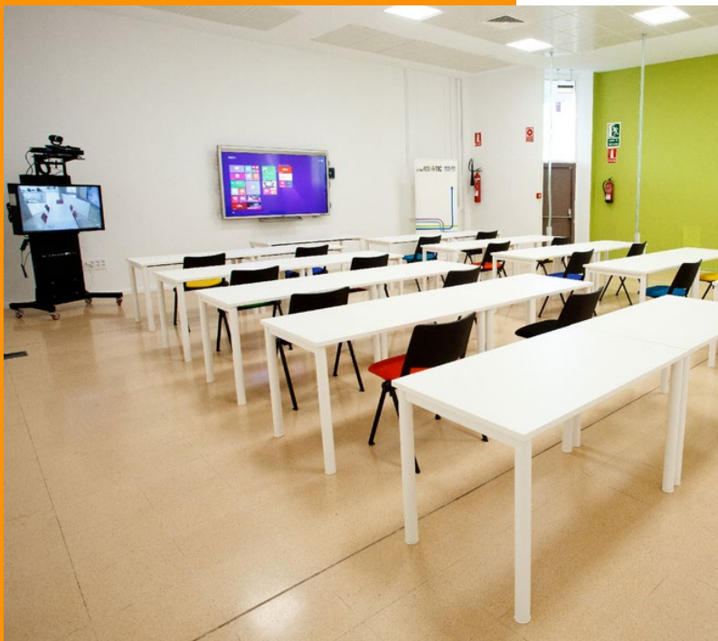
Sala de formación en Edificio CDTIC