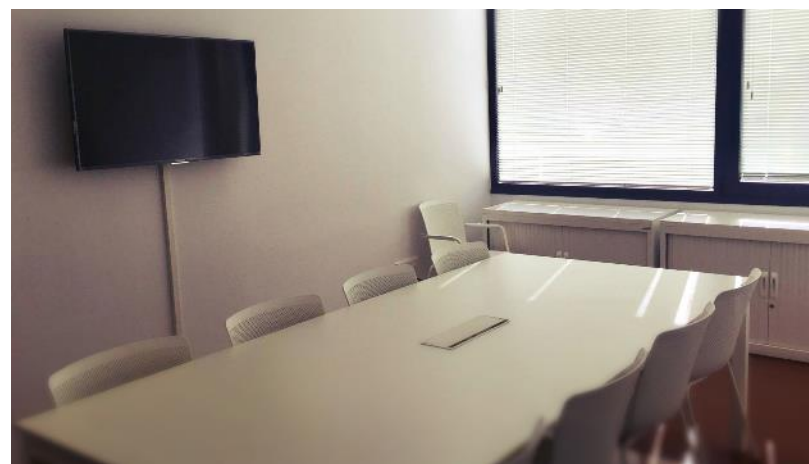
Salas de formación I y II en Edificio Polivalente III