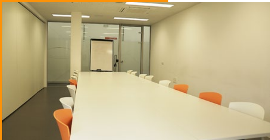
Sala Global 20 en Edificio Incube